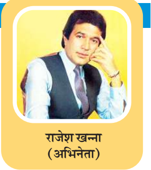
राजेश खन्ना (अभिनेता)

बॉलीवुड का सुपरस्टार कहे जाने लगे। उन्हें फिल्मों में सर्वश्रेष्ठ अभिनय के लिये तीन बार फिल्म फेयर पुरस्कार मिला और 14 बार मनोनीत किया गया। बंगाल फिल्म जर्नलिस्ट एसोसिएशन द्वारा हिन्दी लोक सभा सीट से पाँच वर्ष 1991-96 तक कांग्रेस पार्टी के सांसद रहे। बाद में उन्होंने राजनीति से सन्यास ले लिया। 2005 में उन्हें फिल्मफेयर का लाइफटाइम अचीवमेण्ट अवार्ड दिया गया। राजेश खन्ना हिन्दी सिनेमा के पहले सुपर स्टार थे। 1966 में उन्होंने आखिरी खत नामक फिल्म से अपने अभिनय की शुरुआत की। राज़, बहारों के सपने, आखिरी खत - उनकी लगातार तीन कामयाब