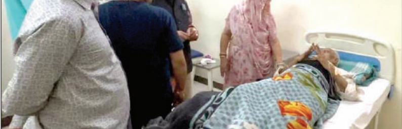
सिरोही अस्पताल में उपचाररत बुजुर्ग व सीसी टीवी फुटेज में हमले की घटना।