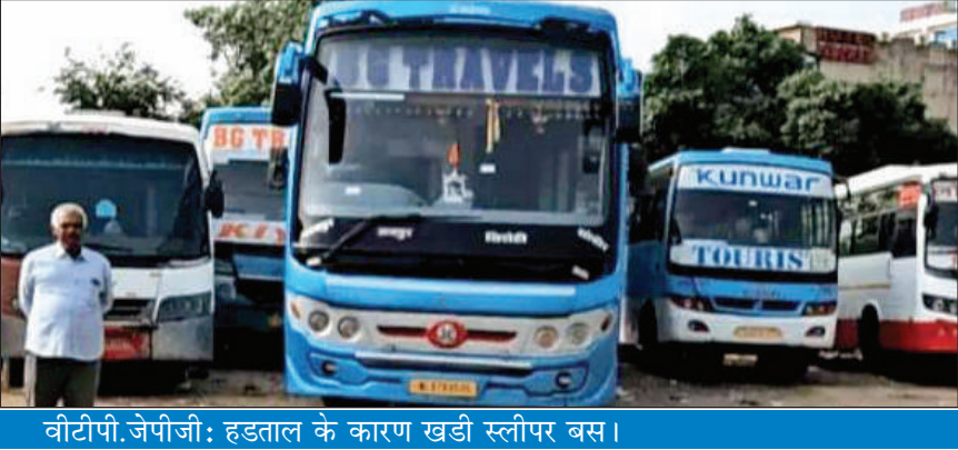
वीटीपी.जेपीजी: हड़ताल के कारण खड़ी स्लीपर बस।

संचालकों ने आरोप लगाया कि जब विभाग बसों को पास करता है, तब भी बसों पर कैरीयर (सामान रखने वाला प्रेम) लगा रहता है, फिर भी उन्हें मंजूरी दी जाती है। उन्होंने कहा कि अब उन्हीं बसों पर कार्रवाई करना आरटीओ विभाग की लापरवाही को दर्शाता है। संचालकों ने यह भी कहा कि बसों में ज्वलनशील पदार्थ या ऊपर सामान बांधकर ले जाना गलत है, लेकिन विभाग को पहले ही ऐसे वाहनों को पास नहीं करना चाहिए।