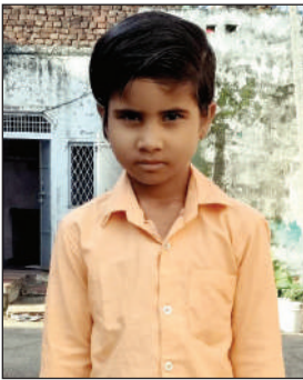
परिजनों की मौजूदगी में पुलिस ने बालिका के शव का पोस्टमार्टम कराया है। घटना को लेकर

बाड़ी ( राजू शर्मा ) । उपखंड की कंचनपुर थाना क्षेत्र के कंचनपुर गांव में बिजली करंट से एक 8 वर्षीय मासूम बालिका की दर्दनाक मौत हो गई। घटना के वक्त मासूम बालिका हॉस्पिटल से दवा लेकर घर लौट रही थी। इस दौरान सड़क किनारे खड़े लोहे के बिजली खंभे से उसे करंट लग गया। घटना के बाद अचेत बालिका को कंचनपुर पुलिस ने बाड़ी अस्पताल पहुंचाया जहां चिकित्सकों ने उसे मृत घोषित कर दिया। घटना के बाद