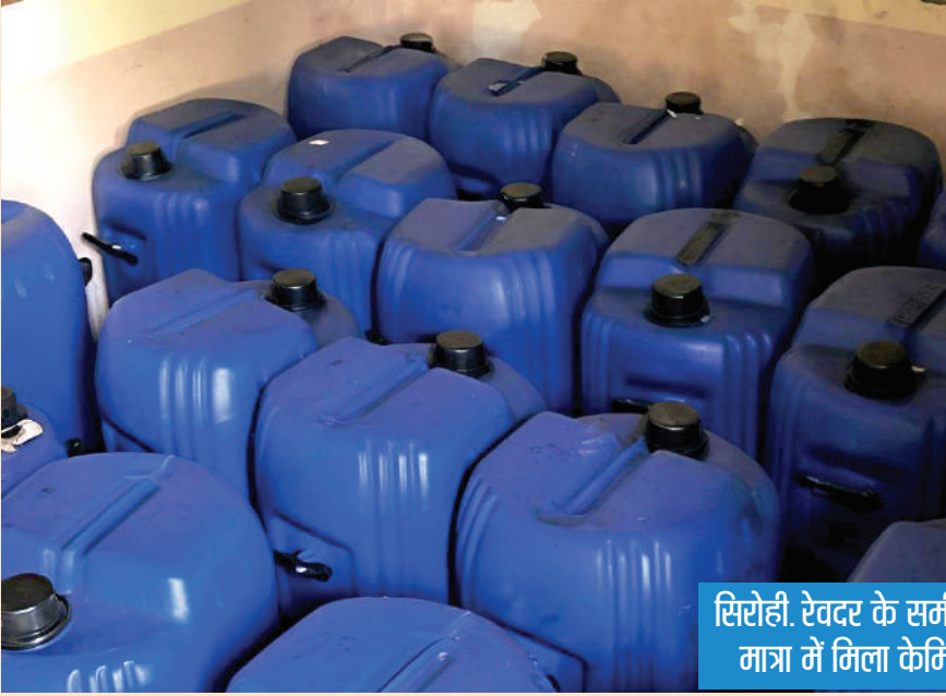
सिरोही. रेवदर के समीप दांतराई में भारी मात्रा में मिला केमिकल व सामान।

बताया जा रहा है कि स्थानीय पुलिस को यहां नकली सामग्री बनाए जाने की सूचना मिली थी। इस पर पुलिस ने दबिश दी, लेकिन