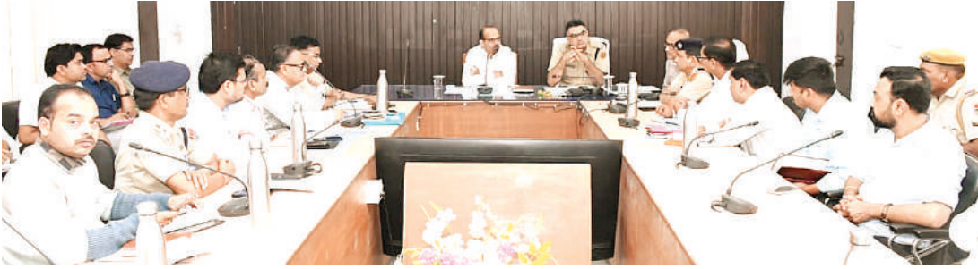
लापरवाही नहीं रहे।

लापरवाही नहीं रहे। इस अभियान का उद्देश्य आम लोगों, वाहन चालकों, पुलिस, सड़क एवं राजमार्ग प्रबंधन, परिवहन, सार्वजनिक निर्माण, चिकित्सा एवं स्वास्थ्य, नगर विकास एवं स्थानीय शासन आदि विभागों तथा दूर एवं ट्रांसपोर्ट कंपनियों, वाहन चालक संगठनों विभागों के अधिकारियों के संयुक्त निगरानी दल गठित किए जाएंगे, जो विभिन्न स्तर पर निगरानी कर यह सुनिश्चित करेंगे कि अभियान की गतिविधियों में कोई