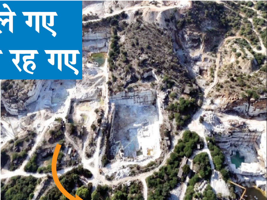
सिरोही- सेलवाड़ा में झोन सर्वे से ली गई खदानों की तस्वीर।