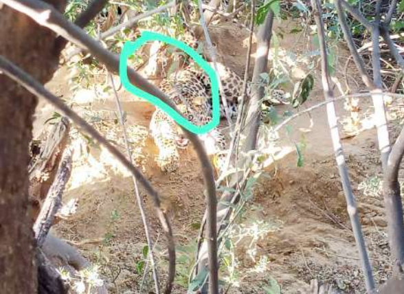
रणथंभौर से आई टीम

चिंता का विषय- सूअर के जाल में फंस रहे पैंथर