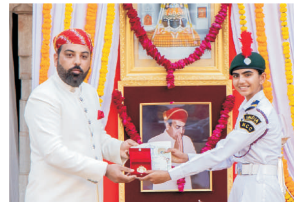
MMFAA - 2025