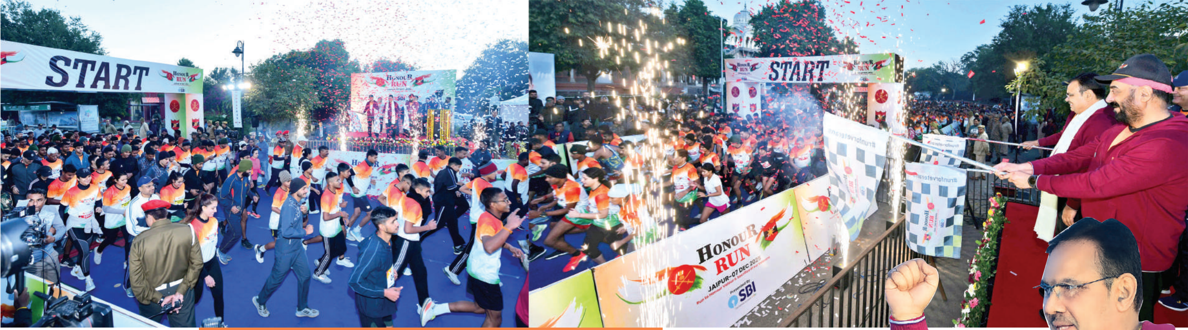
पूर्व सैनिकों के सम्मान में 'ऑनर रन' मैराथन का आयोजन