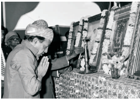
MMFAA - 1980