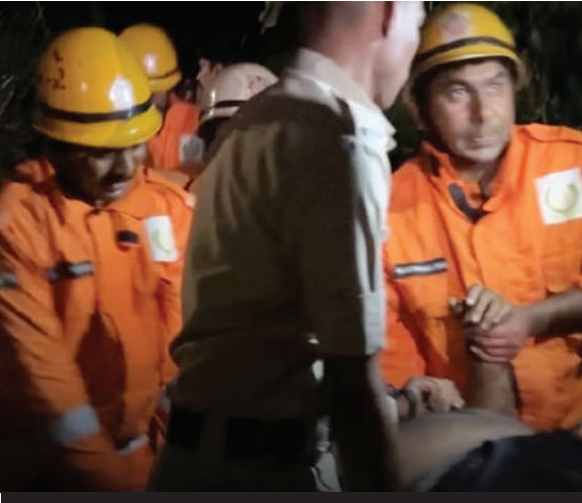
घटना पर किसने क्या कहा-

राष्ट्रपति द्रौपदी मुर्मू ने कहा कि नॉर्थ गोवा में आग लगने की दुखद घटना से बहुत दुख हुआ, जिसमें कई कीमती जानें गईं। दुखी परिवारों के प्रति मेरी गहरी संवेदना है। इस मुश्किल समय में उन्हें हिम्मत मिले। मैं घायलों के जल्दी ठीक होने की प्रार्थना करता हूँ। गृहमंत्री अमित शाह ने कहा कि लोकल एडमिनिस्ट्रेशन बचाव और राहत का काम कर रहा है और प्रभावित लोगों को जरूरी देखभाल दे रहा है। जिन लोगों की जान गई, उनके परिवारों के प्रति मेरी गहरी संवेदना है और घायलों के जल्दी ठीक होने की प्रार्थना करता हूँ। लोकसभा में नेत विपक्ष राहुल गांधी ने टवीटर पर पोस्ट कर हादसे पर दुख जताया। उन्होंने लिखा- यह सिर्फ एक हादसा नहीं सुरक्षा और शासन की क्रिमिनल नाकामी है।