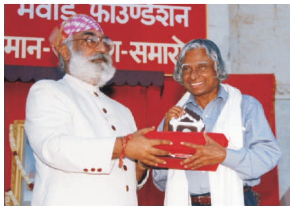
MMFAA - 2002