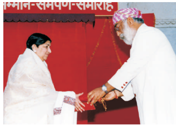
MMFAA - 2002