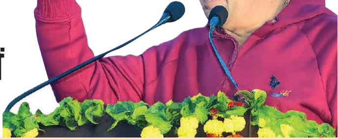
'ऑनर रन' में नजर आया भारी उत्साह और जोश

बढ़ता राजस्थान जयपुर। मुख्यमंत्री भजनलाल शर्मा ने कहा कि हमारे वीर जवान अपने परिवार से दूर रहकर, कठिन परिस्थितियों में निःस्वार्थ भाव से राष्ट्र की सेवा करते हैं। उनके अदम्य साहस और बलिदान के कारण ही हम सभी देशवासी चैन और सुकून से रह पा रहे हैं। उन्होंने कहा कि हमारे पूर्व सैनिक केवल सेवानिवृत्त व्यक्ति नहीं, बल्कि