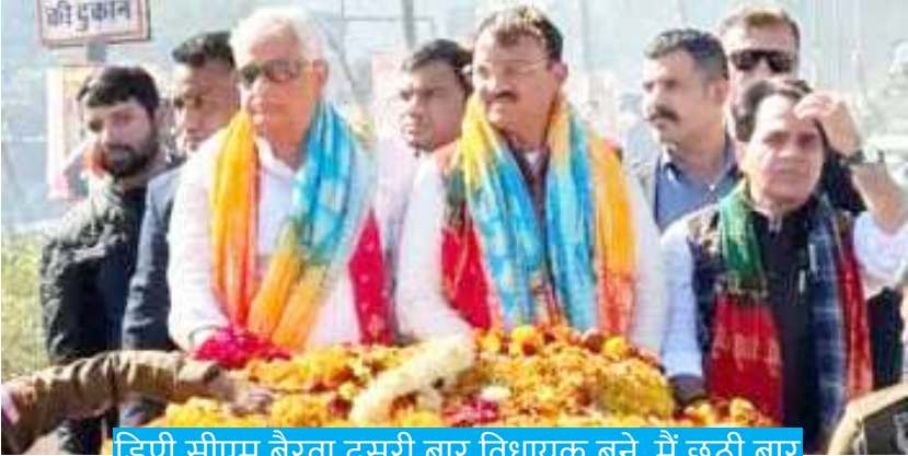
डिप्टी सीएम बैरवा दूसरी बार विधायक बने, मैं छठी बार

कुछ करने लायक तो बनूं। मंत्री के इस बयान ने मंत्रिमंडल विस्तार की सियासी चर्चाओं को हवा दे दी है। दौसा जिले के महुवा में अखिल भारतीय जाटव समाज संगठन की ओर से आयोजित समाज उत्थान समारोह को संबोधित करते हुए मंत्री डॉ. किरोड़ी लाल मीना कहा कि क्षेत्र का विकास कराना मेरी और डिप्टी सीएम डॉ. प्रेमचंद बैरवा की जिम्मेदारी है। इसी बीच लोगों ने महुवा को जिला बनाने की मांग उठा दी। जिस पर किरोड़ी मीना ने कहा कि अभी तो मैं उप (डिप्टी सीएम) भी नहीं बना। कुछ करने लायक तो बनूं।