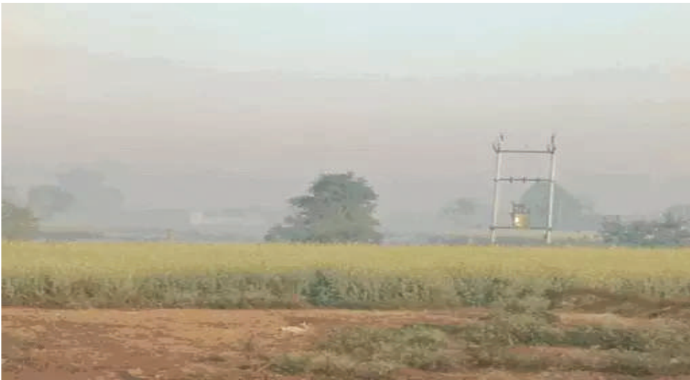
धूप तेज होने से अधिकतम तापमान बढ़ा

जयपुर। राजस्थान में कोहरे के साथ ही अब हल्की ठंडी हवाएं भी चलनी शुरू हो गई हैं। ठंडी हवाओं के प्रभाव से शेखावाटी के अलावा जयपुर, अजमेर, कोटा, उदयपुर संभाग के इलाकों में तापमान में गिरावट दर्ज हुई। फतेहपुर, डूंगरपुर, लूणकरणसर और नागौर में न्यूनतम तापमान 5 डिग्री सेल्सियस से नीचे दर्ज किया गया। मौसम विशेषज्ञों के अनुसार, राज्य में अगले एक-दो दिन मौसम साफ रहेगा। 18-19 दिसंबर से उत्तर भारत में एक नया पश्चिमी विक्षोभ सक्रिय होगा, जिसके असर से राजस्थान के उत्तर-पश्चिमी जिलों में 19 से 22 दिसंबर के बीच कहीं-कहीं हल्के बादल छा सकते हैं। बुधवार को सबसे कम न्यूनतम तापमान 3.7 डिग्री सेल्सियस नागौर में दर्ज किया गया। फतेहपुर में न्यूनतम तापमान 3.8, लूणकरणसर में 4.3, डूंगरपुर में 4.9 डिग्री सेल्सियस दर्ज हुआ। शेखावाटी के सीकर, फतेहपुर, चूरु, पिलानी क्षेत्र के अलावा नागौर और बीकानेर के आसपास हल्की ठंडी हवाओं का प्रभाव रहा। इन इलाकों में सुबह-शाम कड़ाके की सर्दी का दौर एक बार फिर शुरू हो गया। श्रीगंगानगर, हनुमानगढ़ और बीकानेर में बुधवार को भी कोहरा छाया रहा।