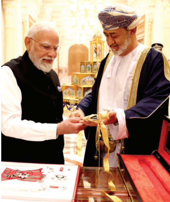
भारत-ओमान के बीच CEPA समझौता होगा

ओमान पहुंचे पीएम मोदी ने गुरुवार को कहा कि कितने भी मौसम बदल जाए लेकिन भारत से