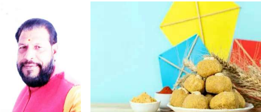
मकर संक्रांति पर क्या करें दान