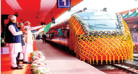
पीएम मोदी ने दिखाई हरी झंडी

कोलकाता/गुवाहाटी। पश्चिम बंगाल के मालदा में शनिवार को पीएम मोदी ने कहा कि बंगाल के सामने एक बड़ी चुनौती घुसपैठ की है। बंगाल के कई इलाकों में आबादी का संतुलन बिगड़ रहा है। टीएमसी घुसपैठियों को वोटर बना रही। गरीबों का हक छीना जा रहा है। भाजपा सरकार बनते ही घुसपैठियों पर एक्शन लिया जाएगा। आयुष्मान भारत योजना पर बात करते हुए पीएम ने कहा कि टीएमसी वालों को आपकी तकलीफ की कोई चिंता नहीं है। यहां आयुष्मान योजना लागू नहीं होने दी गई है। ऐसी पत्थर दिल सरकार की बंगाल से विदाई जरूरी है। पीएम ने मालदा में भारत की पहली वंदे भारत स्लीपर ट्रेन का उद्घाटन किया। यह ट्रेन हावड़ा से गुवाहाटी के बीच चलेगी। उन्होंने ट्रेन के ड्राइवर से मुलाकात और उसके बारे में जाना। पीएम ने ट्रेन में मौजूद बच्चों से भी बात की।